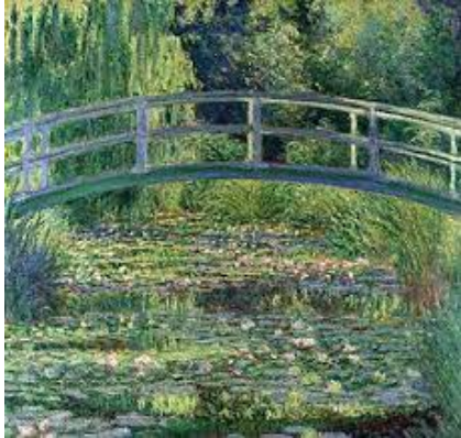
"Le ninfee"- Monet

Qui riportiamo due opere, una realizzata da Claude Monet, l'altra da un'intelligenza artificiale chiamata DALL-E 2 con il prompt: "Illustrazione di ninfee su acqua".